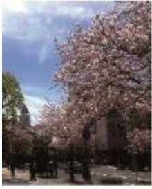
本校のソメイヨシノ