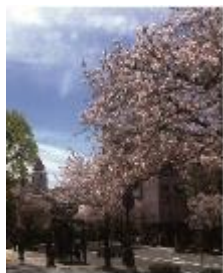
本牧のソメイヨシノ

例会開催時:毎週木曜日(12時30分~13時30分) 例会場:KKRポートヒル横浜 〒231-0862 横浜市中区山手町115(港の見える丘公園となり) Phone:045-621-9684 F