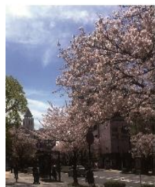
本牧のソメイヨシノ

例会開催時:毎週木曜日(12時30分~13時30分) 例会場:KKRポートヒル横浜 〒231-0862 横浜市中区山手町115(港の見える丘公園となり) Phone:045-621-9684 Fax:045-621-6667 事務局 〒231-0862 横浜市中区山手町115 KKRポートヒル内 Phone & Fax 045-621-5251