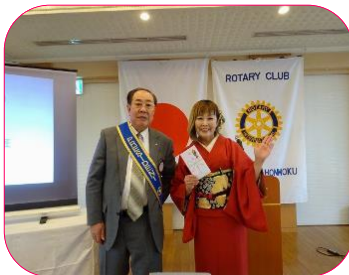
清國 一利 会長 三遊亭 絵馬 師匠