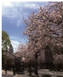
本牧のソメイヨシノ