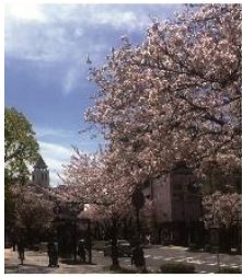
本牧のソメイヨシノ