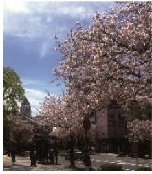
本牧のソメイヨシノ