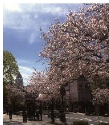
本牧のソメイヨシノ