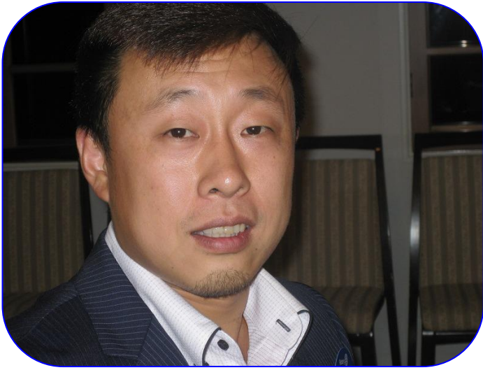
高 鷲 様