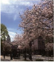
本牧のソメイヨシノ