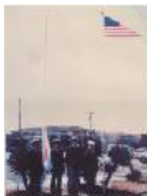
桜の解禁、開うされる皇承継