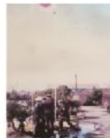
揚げられた日本国旗